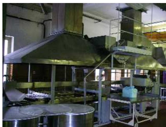
Obr. č. 2 Průběžná fritovací linka

V restauracích i pekárenských provozech je zpravidla kolem smažících zařízení stísněný prostor a světlá výška místnosti bývá snížena digestoří pro odtah par ze smažících lázní.