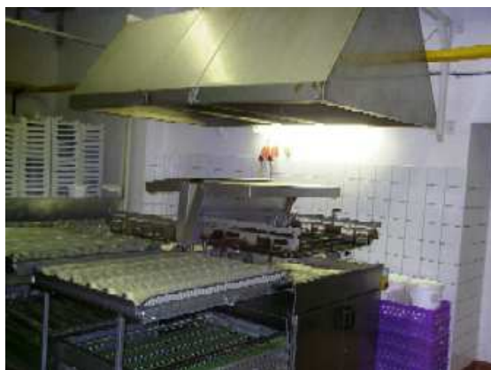
Obr. č. 1 Fritéza o objemu 150 l