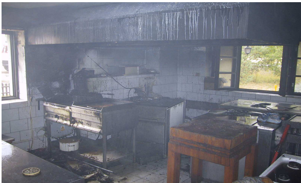
Obr. č. 3 Celkový pohled na přípravnu jídel s fritézou po požáru