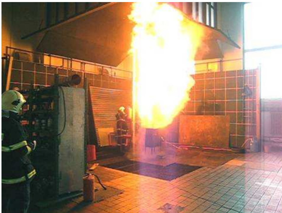
Obr. č. 5 Nárůst objemu plamene při použití mlhového proudu s pěnidlem AFFF

Rovněž hasební prášky BC, které jsou účinné při hašení hořlavých kapalin a plynů, stejně jako univerzální prášky ABC jsou z hlediska jimi daného způsobu přerušení hoření naprosto nevhodné a také nebezpečné pro hašení požáru třídy F. V důsledku kinetické energie hasebního prášku, která je nutná pro jeho podání do zóny hoření dochází k jeho nárazu na hladinu oleje a vystřelování prachových částic obalených olejem ve shlucích do okolí, což představuje značné nebezpečí pro zasahující osoby a může vést k dalšímu rozšíření požáru.