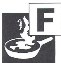
Obr. č. 7 Piktogram pro požáry třídy F

V současné době jsou pro třídu požáru F, tj. požáry rostlinných nebo živočišných olejů a tuků v kuchyňských spotřebičích doporučována následující hasiva, která byla certifikována podle EN 3-7+A1:2008 pro přenosné hasicí přístroje – část 7: Vlastnosti, požadavky na hasicí schopnost a zkušební metody. Tyto hasicí přístroje jsou na typovém štítku opatřeny piktogramem pro třídu požáru F.