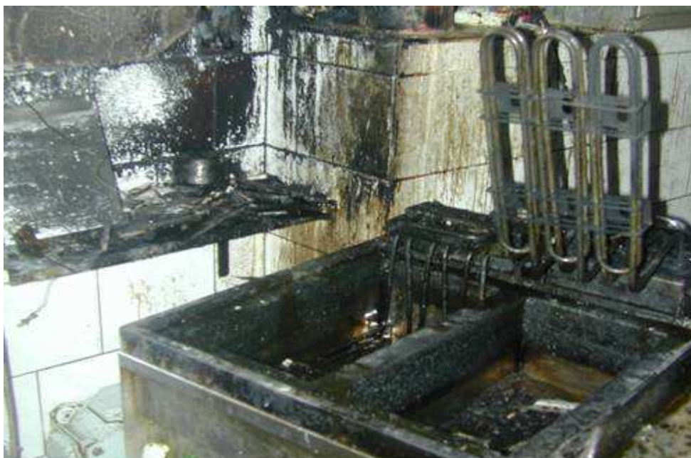
Obr. č. 4 Fritéza po požáru