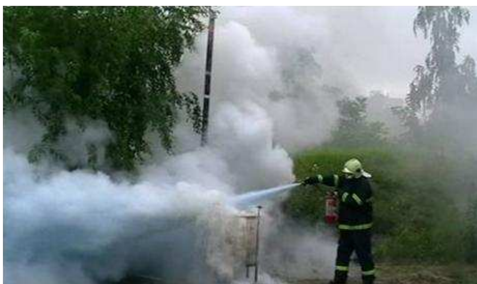
Obr. č. 6 Rozstříkávání olejové lázně při použití hasebního prášku ABC

Rovněž hasební prášky BC, které jsou účinné při hašení hořlavých kapalin a plynů, stejně jako univerzální prášky ABC jsou z hlediska jimi daného způsobu přerušení hoření naprosto nevhodné a také nebezpečné pro hašení požáru třídy F. V důsledku kinetické energie hasebního prášku, která je nutná pro jeho podání do zóny hoření dochází k jeho nárazu na hladinu oleje a vystřelování prachových částic obalených olejem ve shlucích do okolí, což představuje značné nebezpečí pro zasahující osoby a může vést k dalšímu rozšíření požáru.