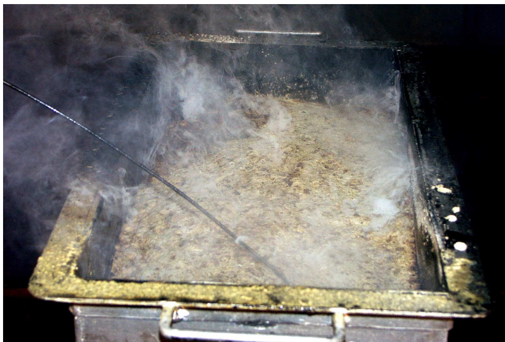
Obr. č. 8 Pohled na zmydelnatělou krustu po použití hasiva Neufrol M – „meterin“

Na základě zkoušek provedených v TÚPO Praha byl úspěšně ověřen pro hašení požárů třídy F vodný roztok uhličitanu draselného K_2CO_3 (potaš) v dávkování 6 kg technicky čisté potaše na 10 l vody.